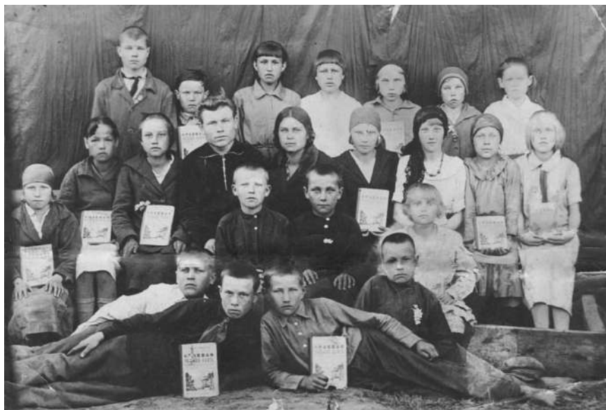
4 класс Рудовской начальной школы 1929-1930 г.