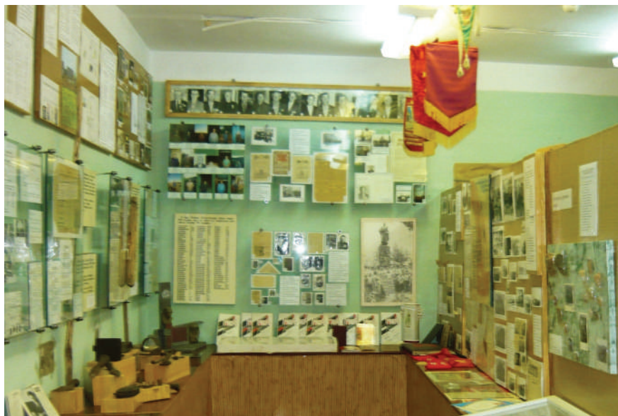
Великая Отечественная война - наша горькая память