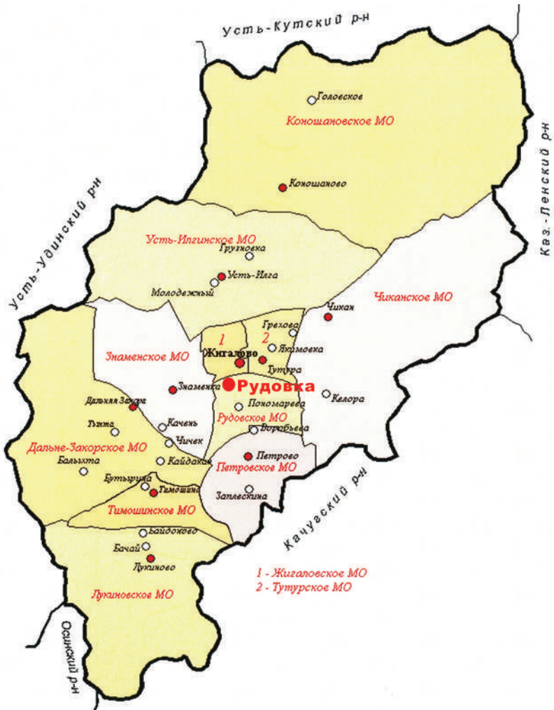
Карта-схема Жигаловского района