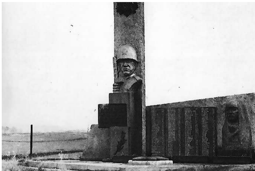
Памятник погибшим в ВОВ в Рудовке