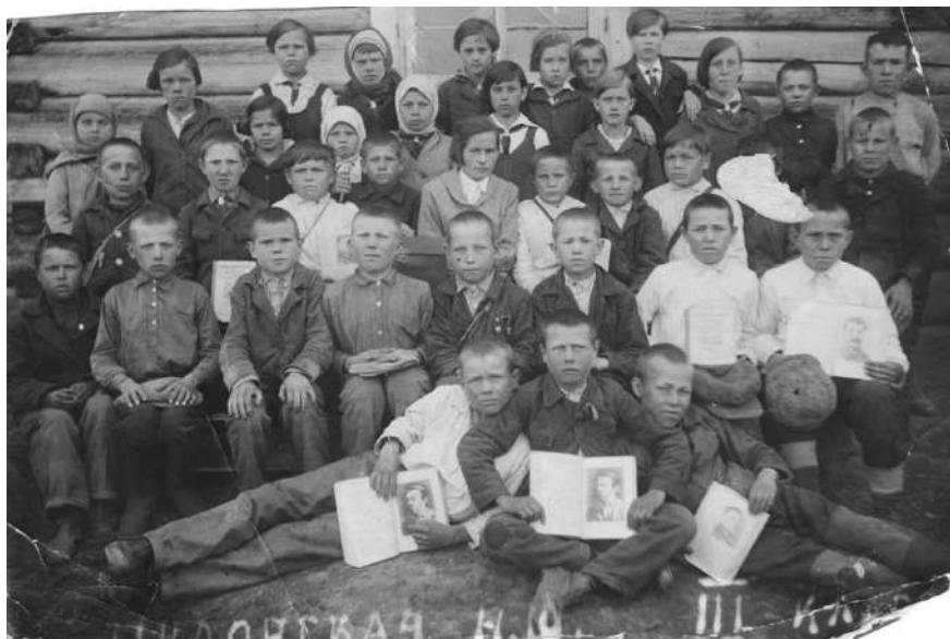
3 класс Рудовской начальной школы 1933 г.