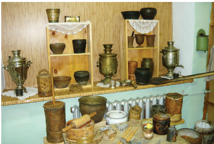
Кухонные принадлежности, XVIII-XIX вв.