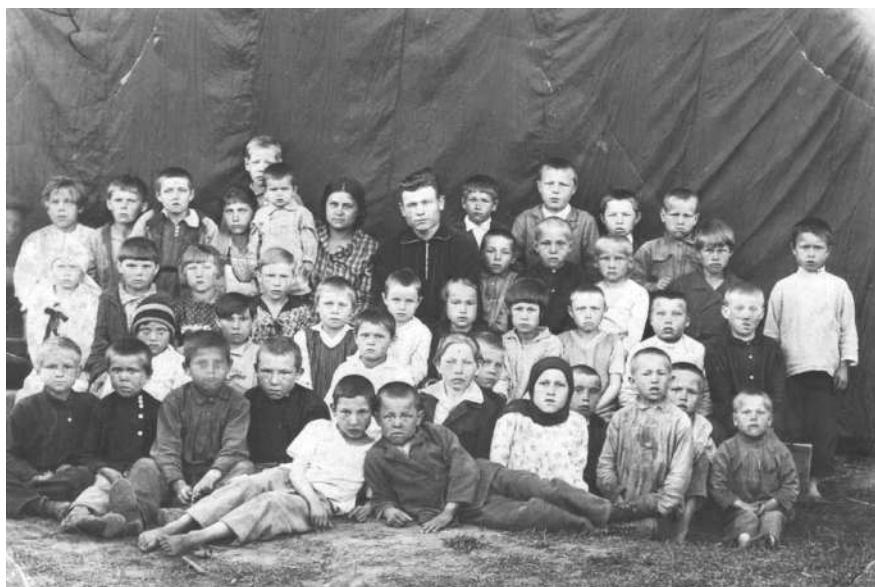
2 класс Рудовской начальной школы 1935-1936 г.