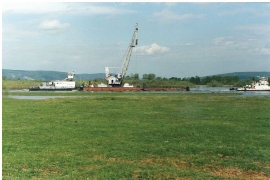
Строительство газопровода, 2007 год