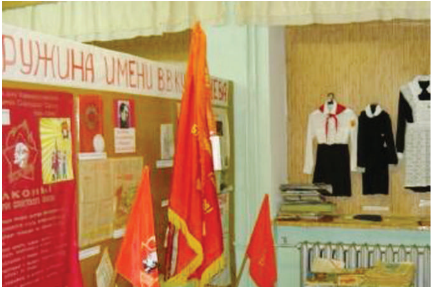
Уголок пионерской атрибутики