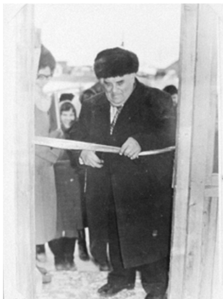
Открытие школьного музея 23 декабря 1982 года