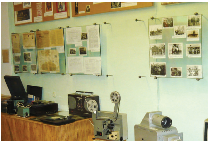
Из всех искусств важнейшим для нас является кино