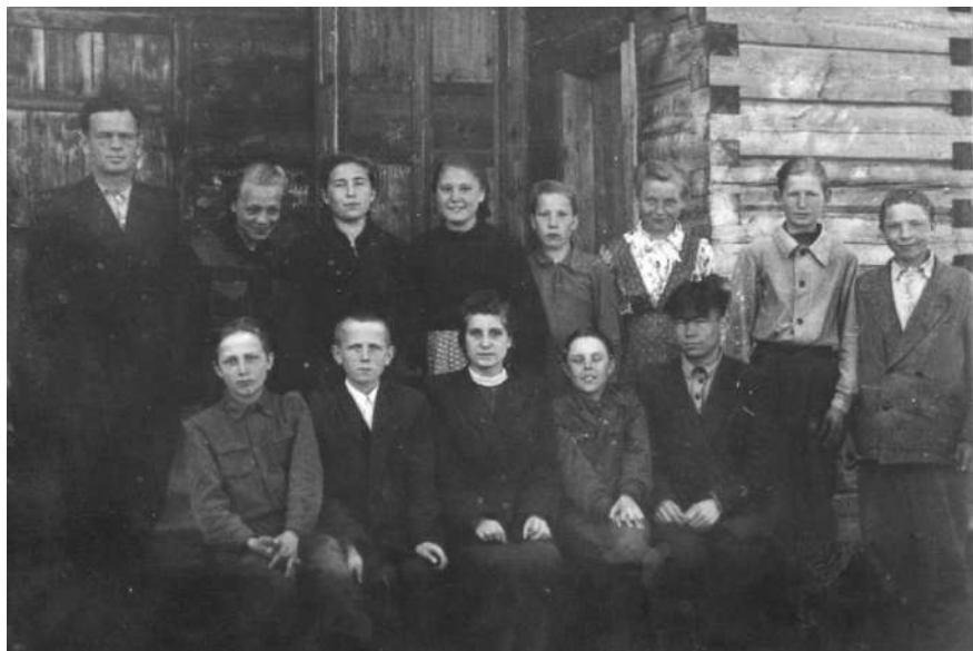
Первый выпуск 7-летней школы, 1952год