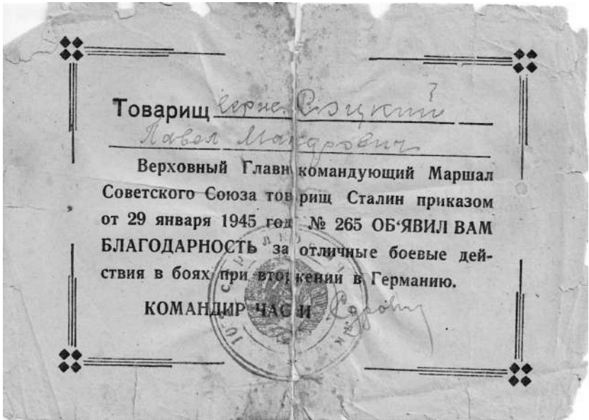
За бои в Германии. 29 января 1945 года