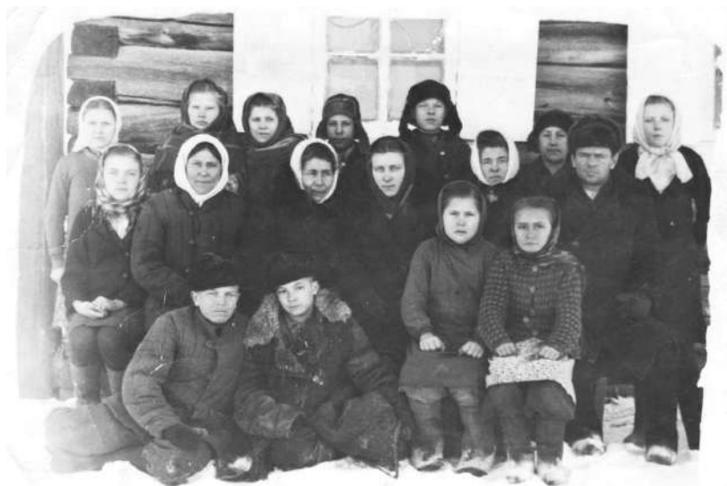
Дети, проживавшие в интернате в год его открытия, 1952г.