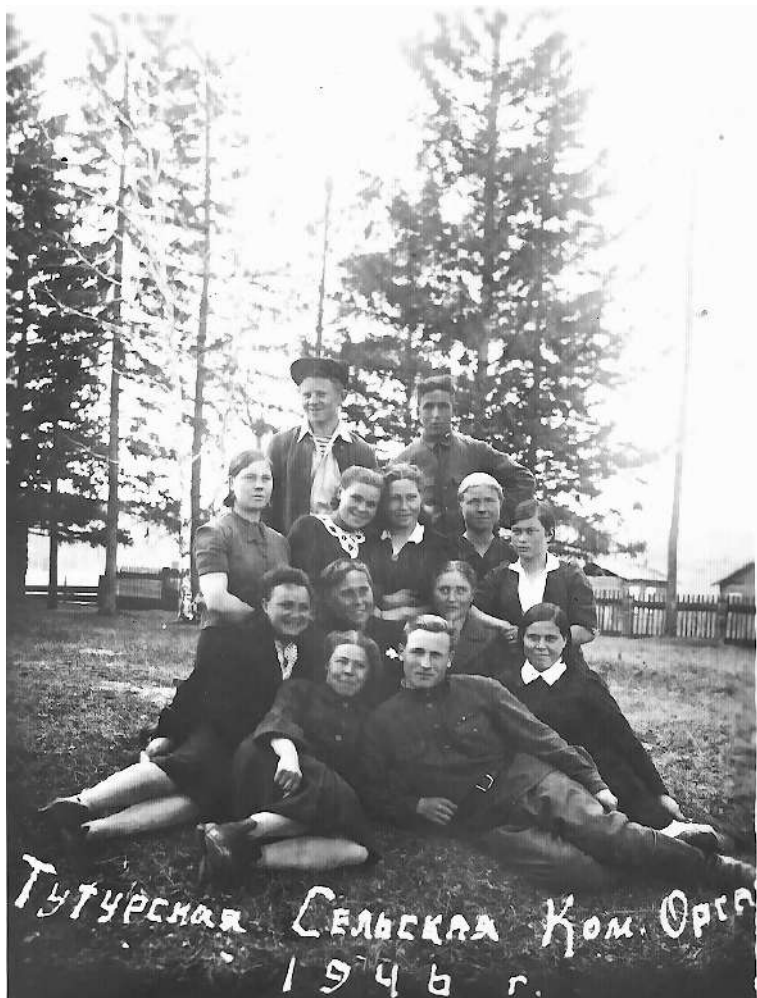
Тутурская сельская комсомольская организация, 1938 г.