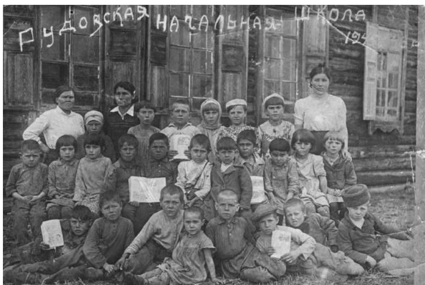
Рудовская начальная школа 1945 г.