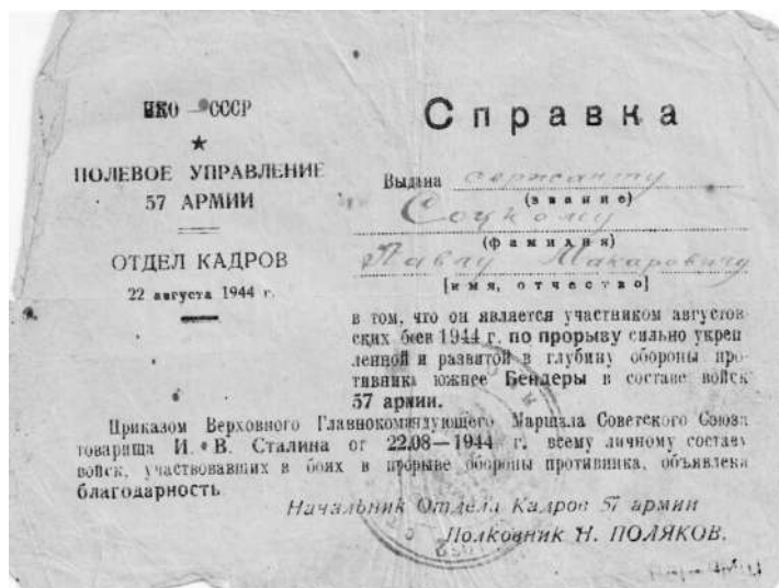
Справка 1. За Бендеры.