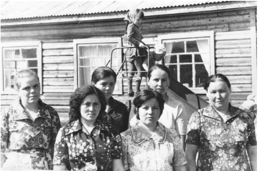
Коллектив детского сада, конец 70-х годов