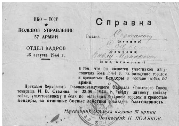
Справка 2. За Бендеры.