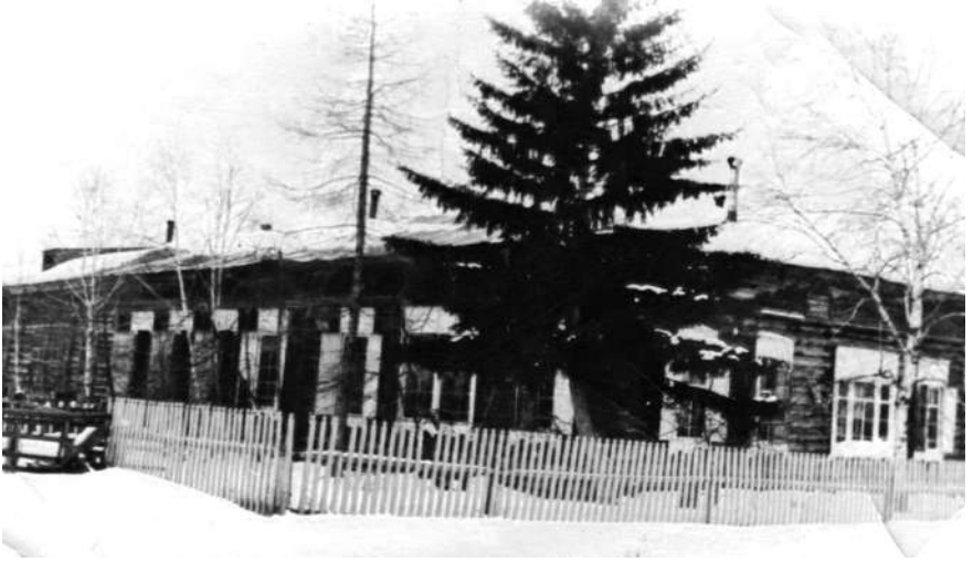
Школа с. Рудовка