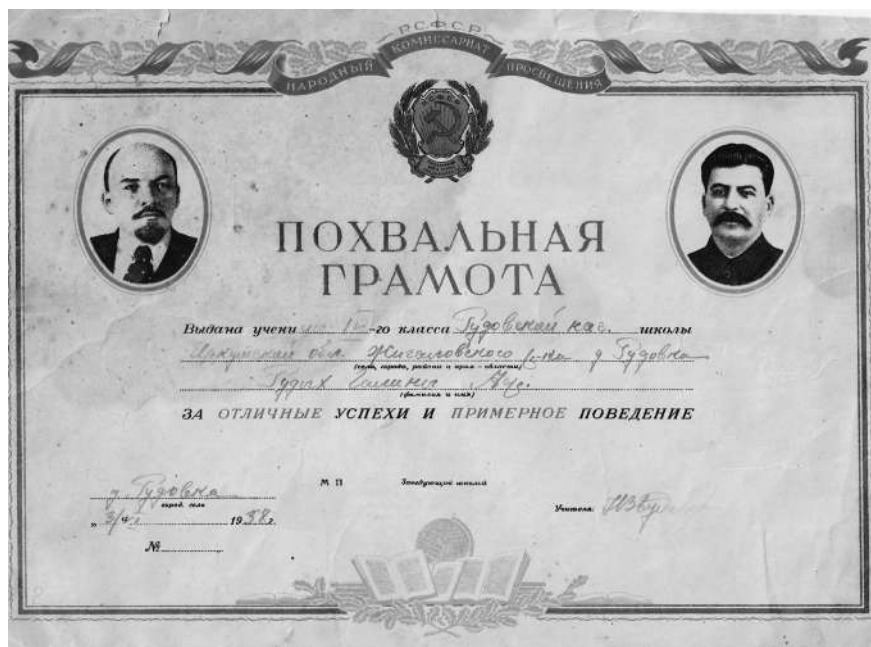
Похвальная грамота Рудых Галине, 1938 г.