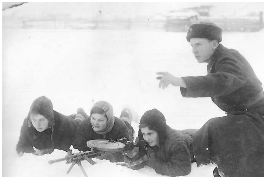
Военная подготовка, 1942 г.