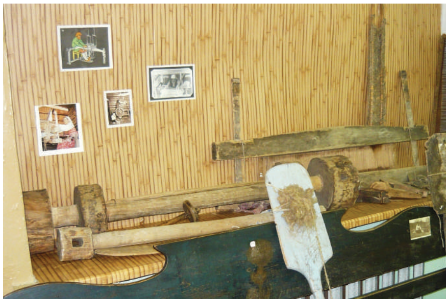
Ткацкие принадлежности, XVIII-XIX вв.