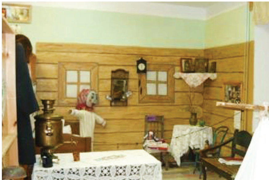
Крестьянский быт, XVIII-XIX вв.