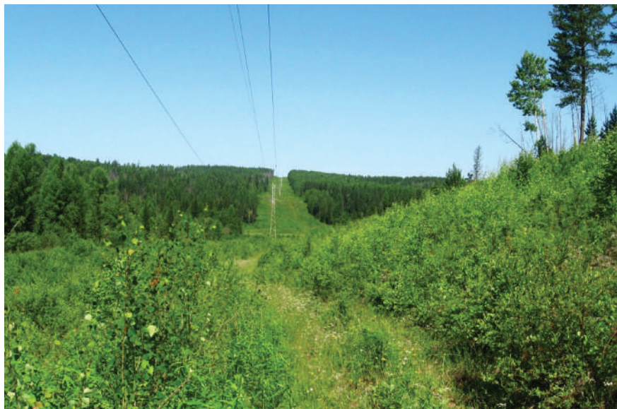
ЛЭП, построена в 70-х годах XX столетия