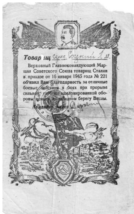
За Вислу. 16 января 1945 года