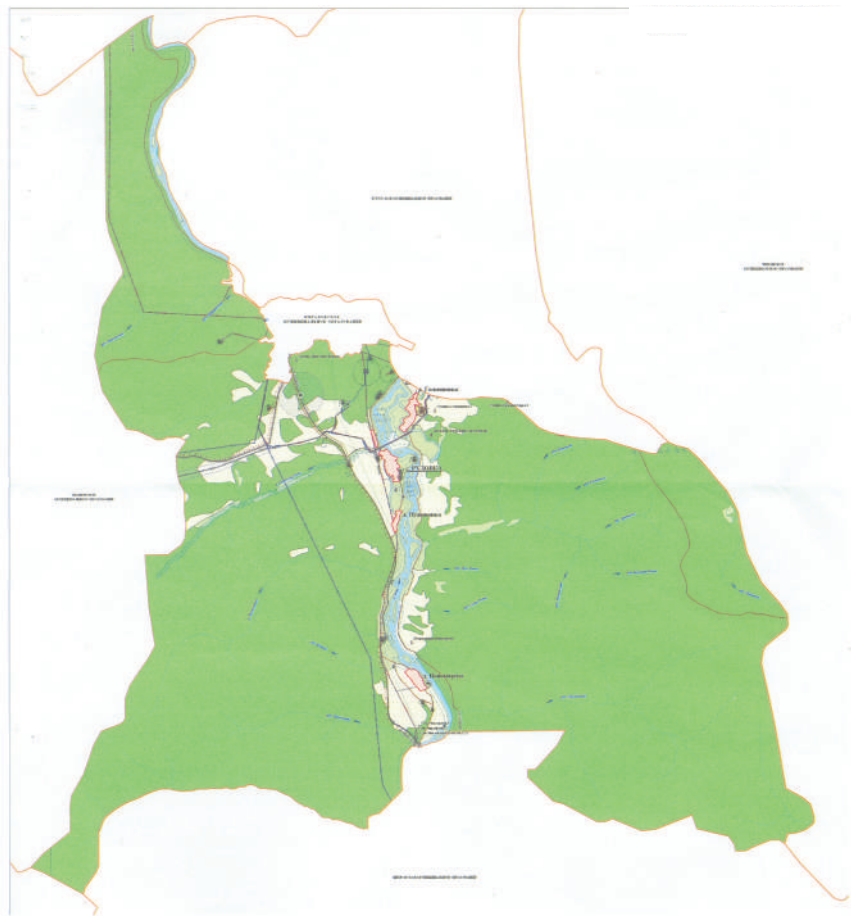
Генеральный план Рудовского муниципального образования Жигаловского района Иркутской области