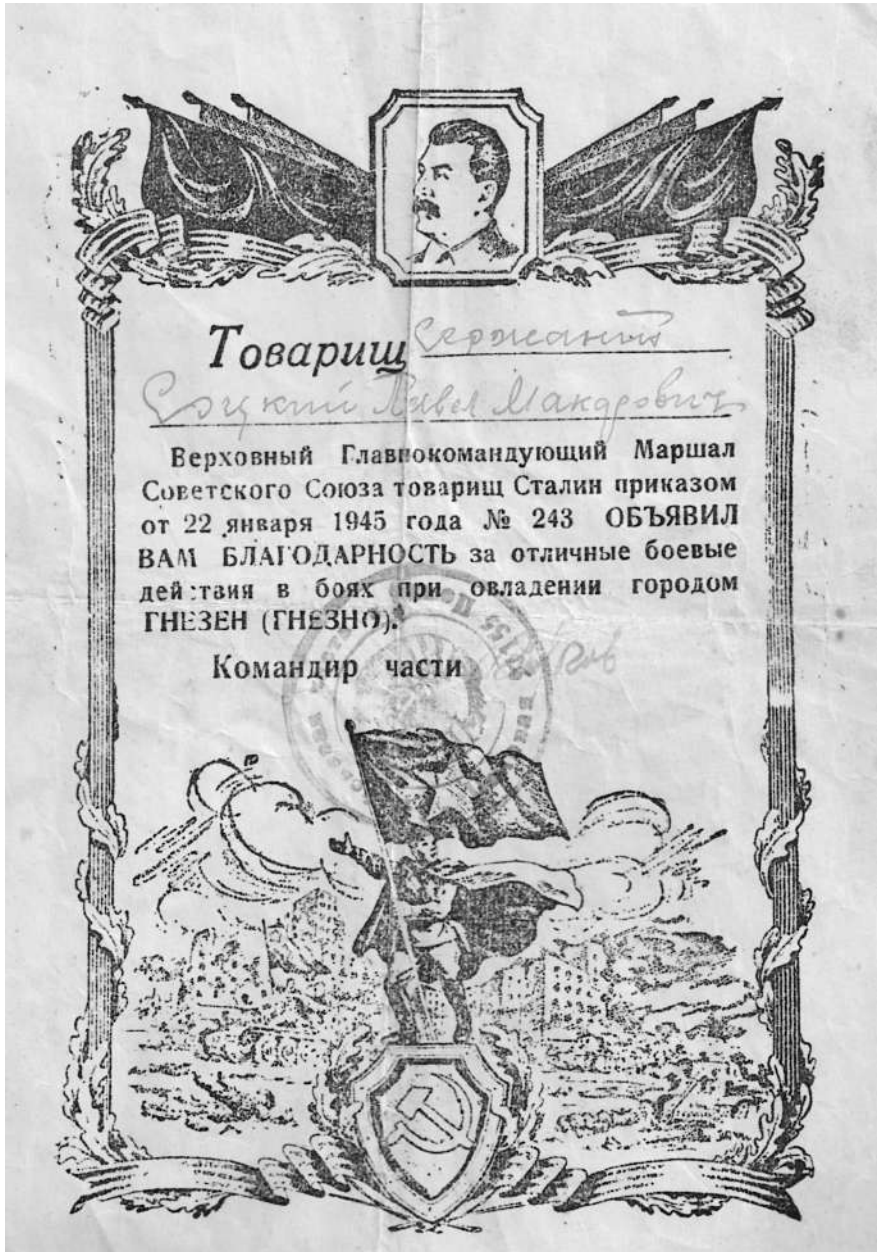
За Гнезен. 22 января 1945 года