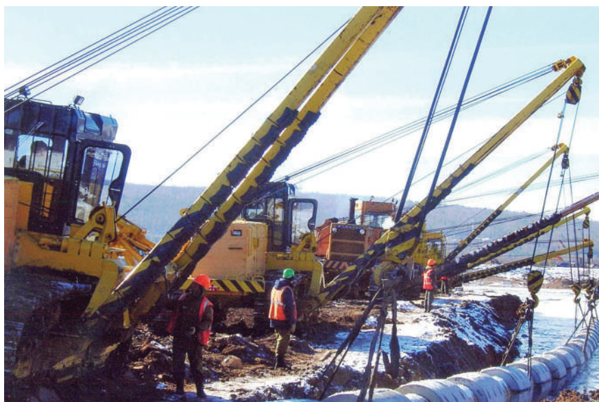
Строительство газопровода, 2007 год